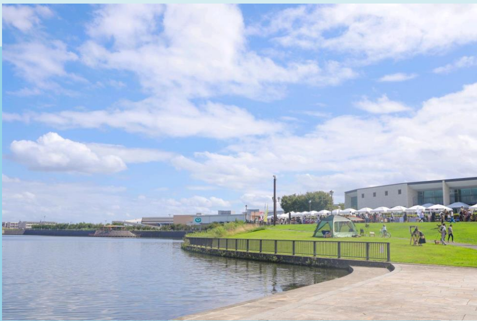
↑大相模調節池（越谷市）