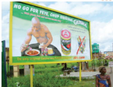
偽物のGEISHAの注意喚起を促す看板