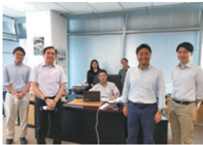
中東川商フーズ社