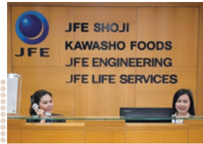
JFE商事とオフィスを共にする タイ川商フーズ社