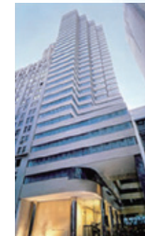
ニューヨークの 米国川商フーズ社