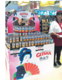
中国のスーパーマーケット での販売風景