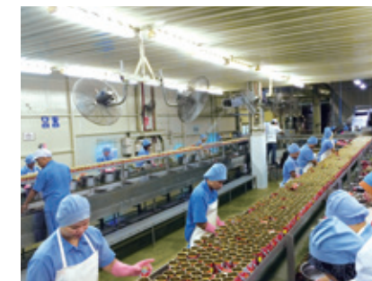
マルシン キャナリーズ(マレーシア)社の工場内