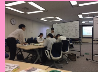
政策の企画・立案プロセス等体験 (原子力規制庁)