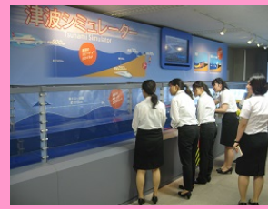
施設等見学 (気象庁)