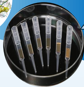
センシングチップ