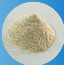
バイオマス抗菌剤