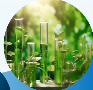
バイオマス粘着剤